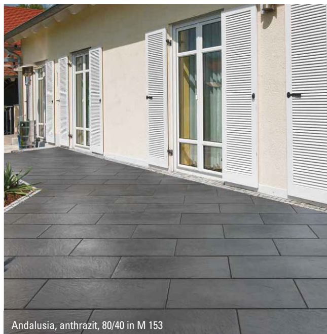
Andalusia, anthrazit, 80/40 in M 153